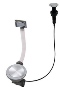
Desagüe automático Space Push - PP 8407 116