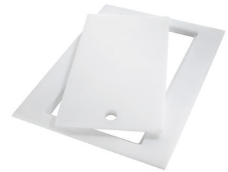
Tabla de corte Twin in HDPE